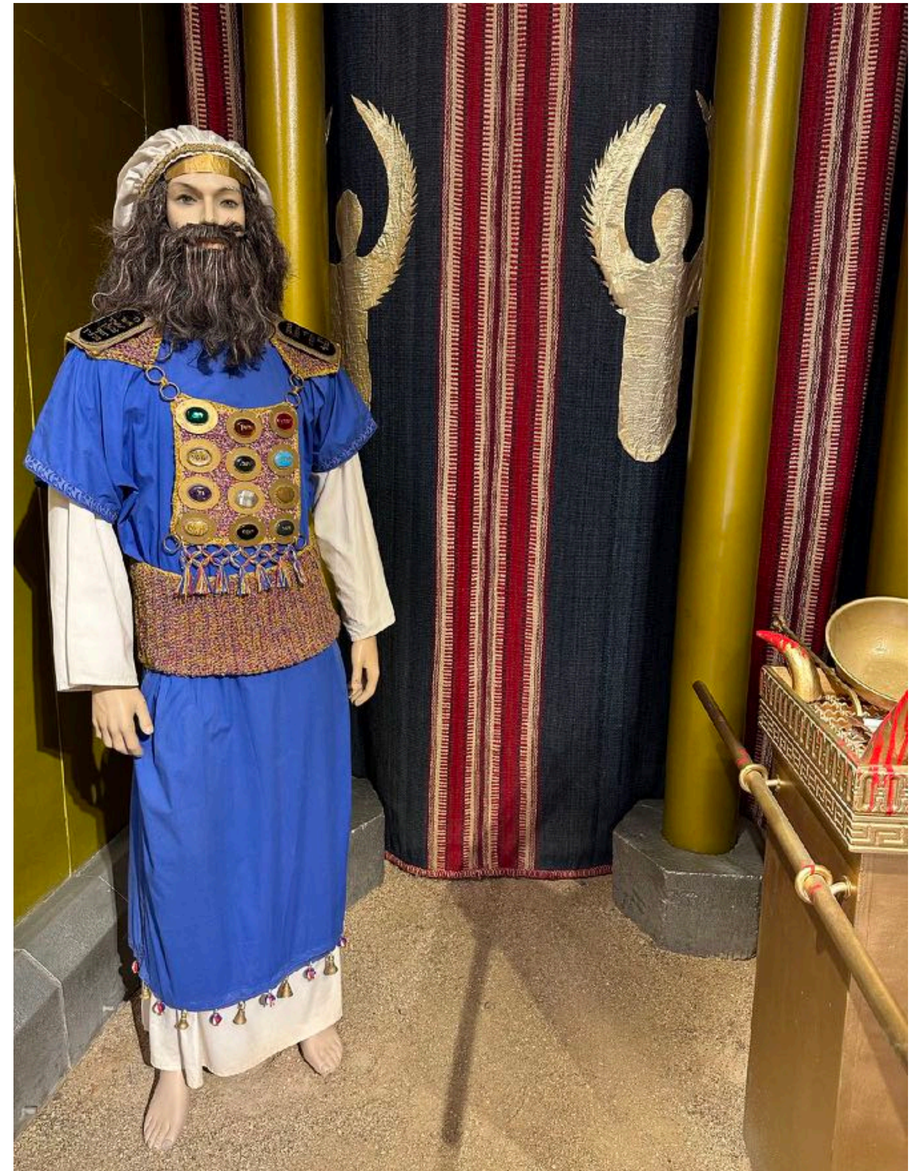
Rekonstruktio ylipapista esiripun edessä ilmestysmajassa