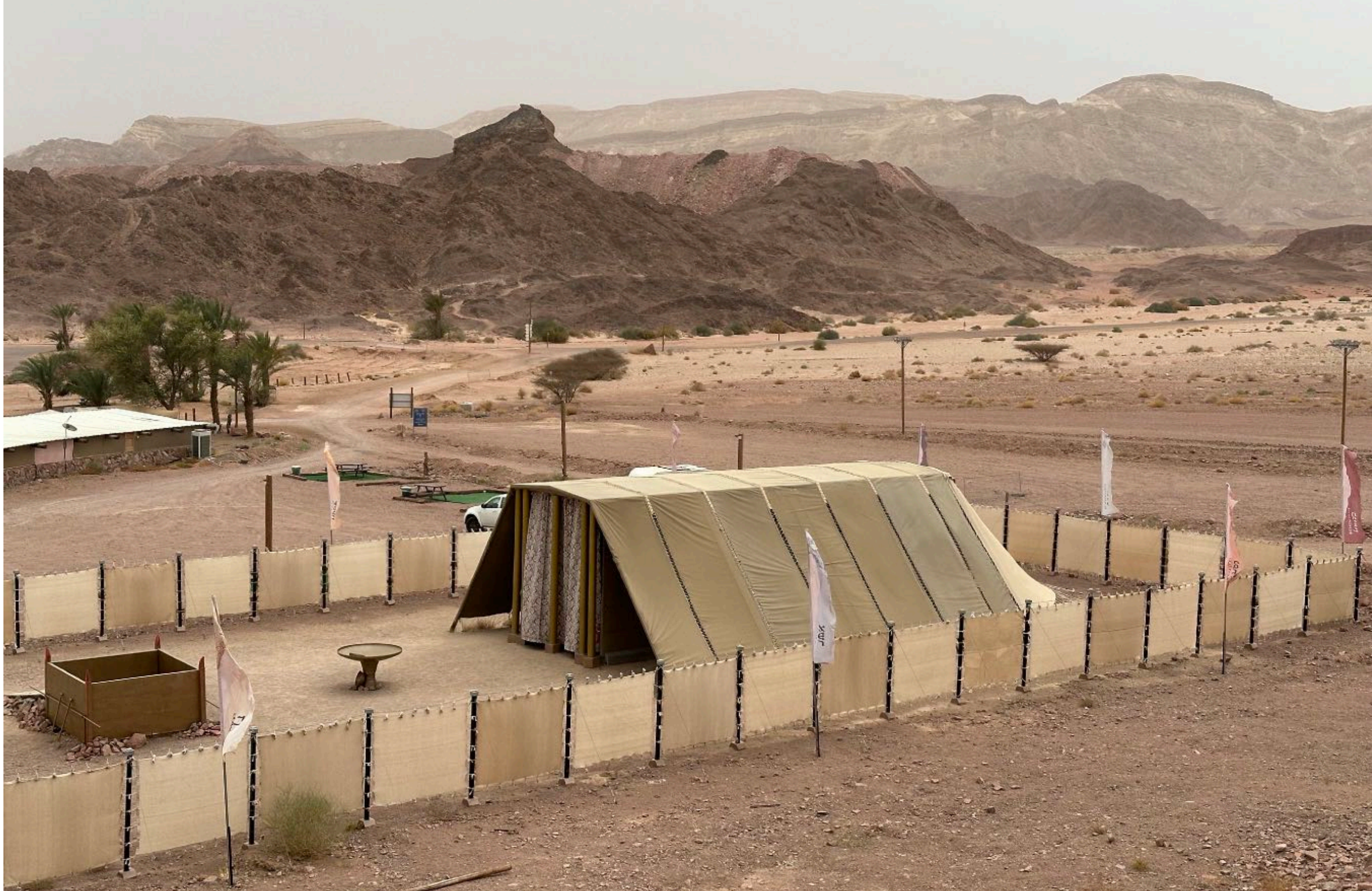
Ilmestysmajan rekonstruktio VT:n mittojen mukaan Timnan kansallispuistossa