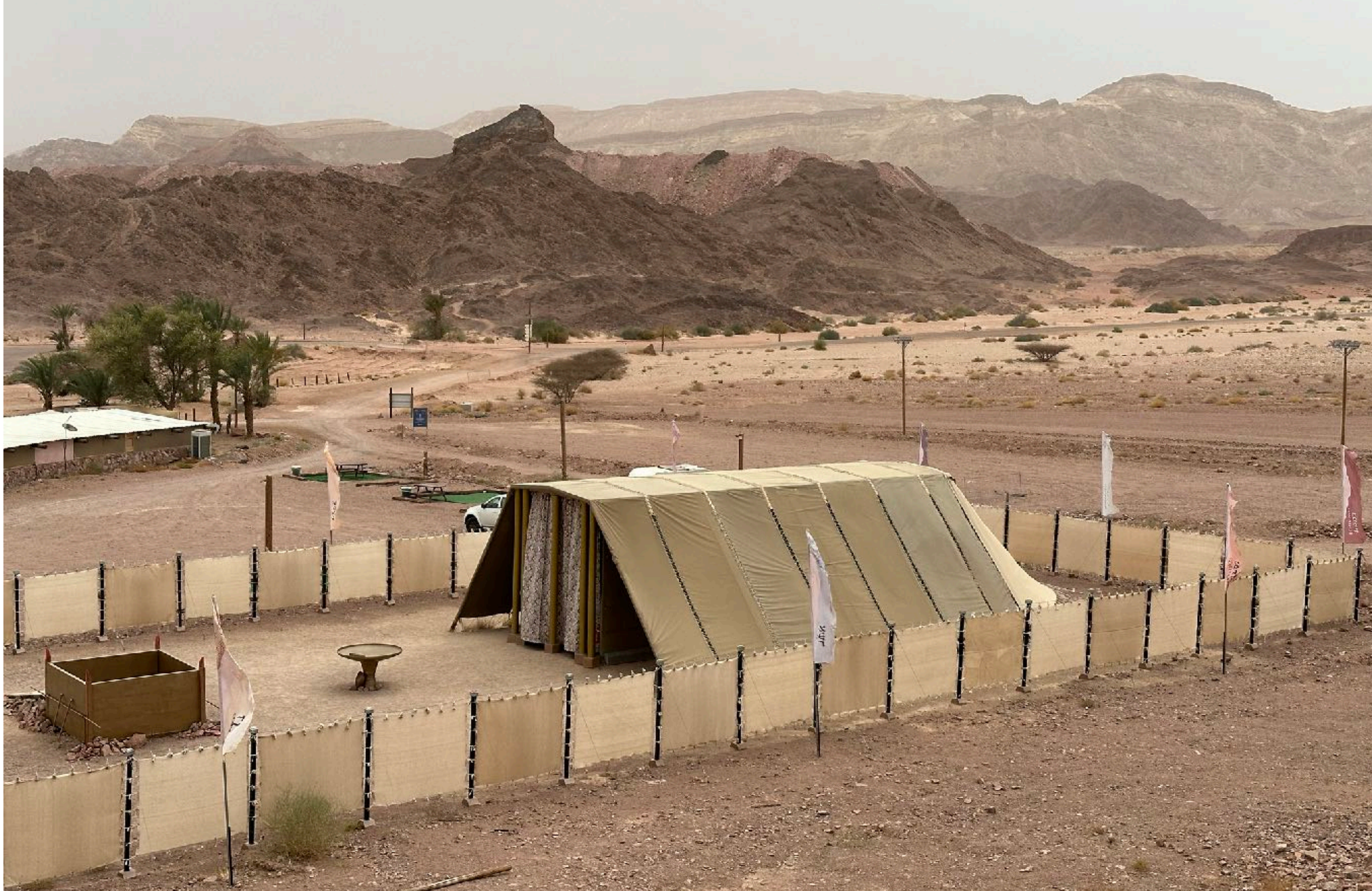
Ilmestysmajan rekonstruktio VT:n mittojen mukaan Timnan kansallispuistossa