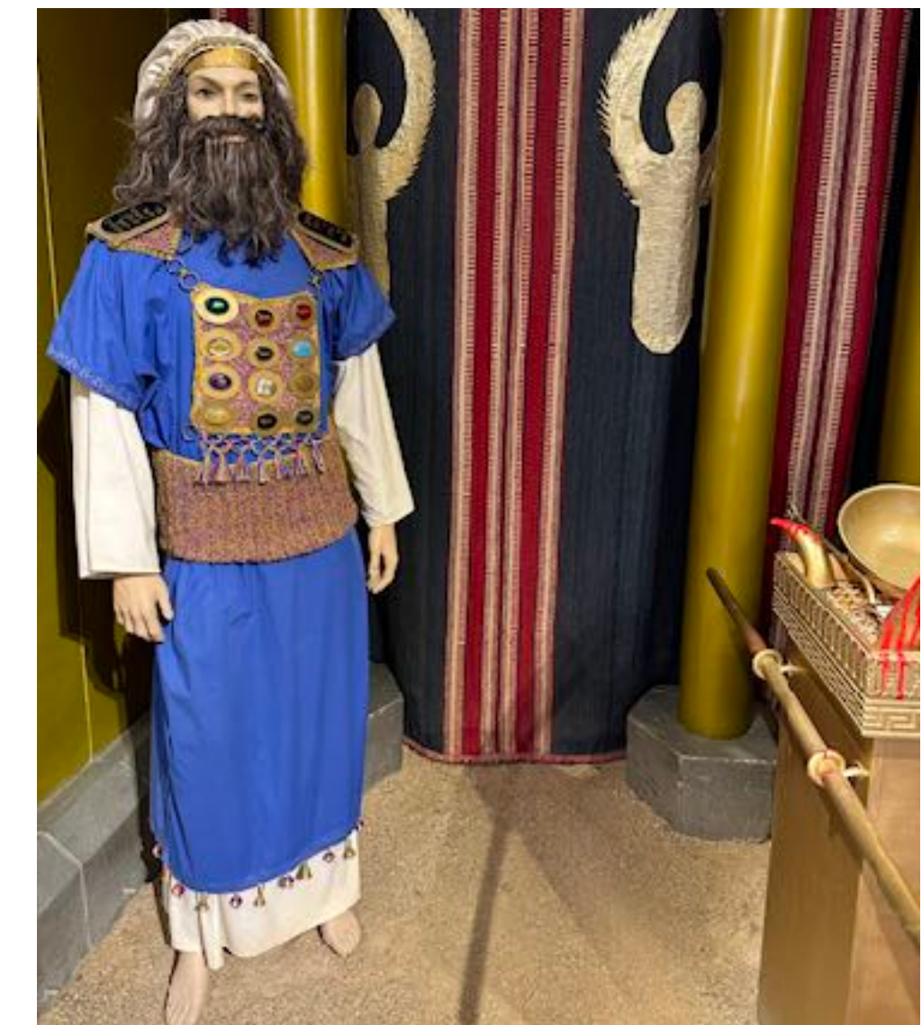
Uhrialttari, ilmestysmaja, pyhä paikka, ylipapin asu ja väliverho kaikkeinpyhimpään