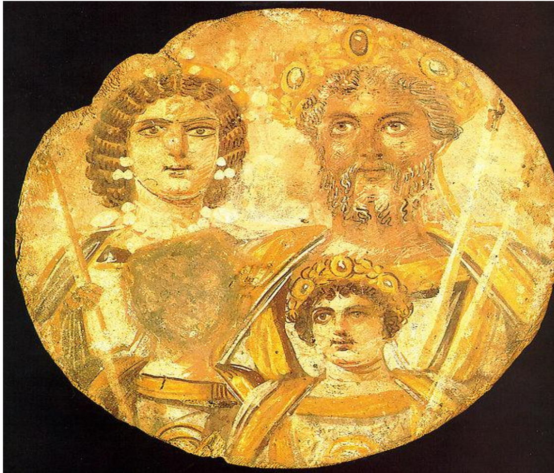
Septimius Severus (k. 211) jumaloituna