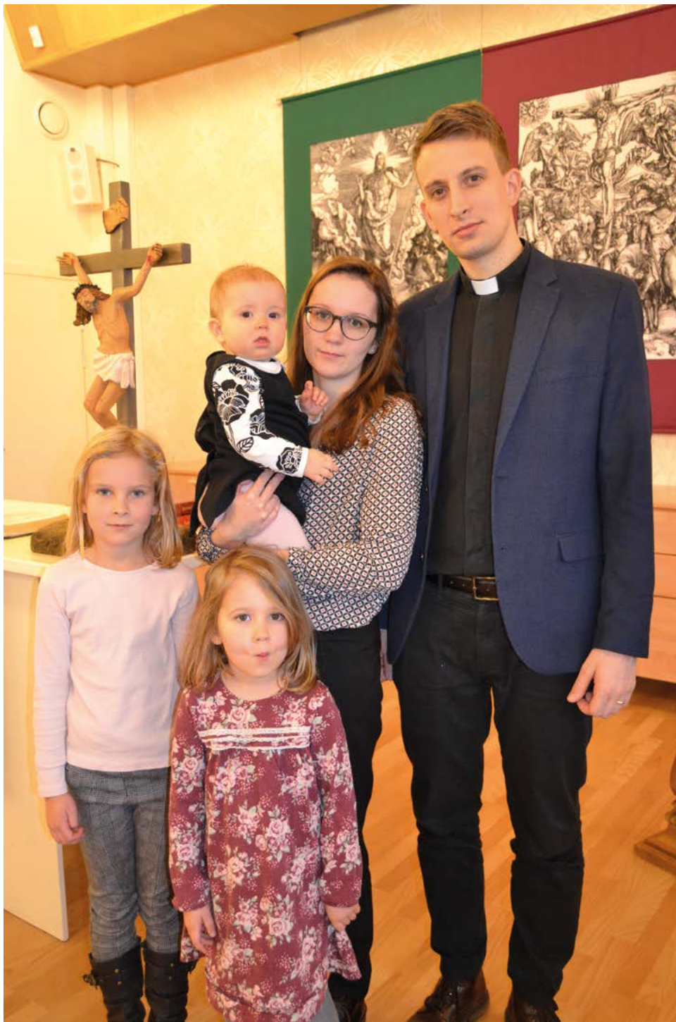
Jimmyn virkaanasettaminen Andreaxen luterilaisen seurakunnan messussa 5.1.

asiat jäivät usein pastoripariskunnan hoidettavaksi.