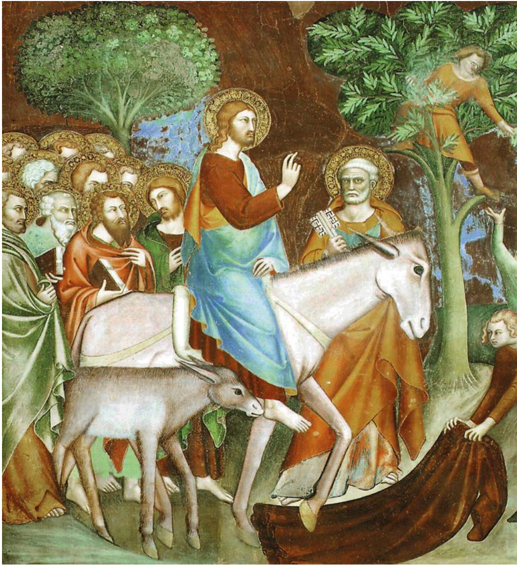
Kristus saapuu Jerusalemiin (Lippo Memmi).

Poika: ”Hän on oleva suuri, häntä kutsutaan Korkeimman Pojaksi, ja Herra Jumala antaa hänelle hänen isänsä Daavidin valtaistuimen. Hän hallitsee Jaakobin sukua ikuisesti, hänen kuninkuudellaan ei ole loppua.” (Luuk. 1:32–33.)