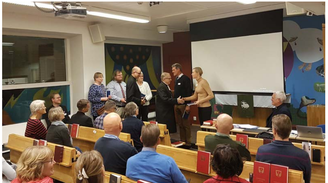
Ruotsinkielinen katekismus jaetaan seurakuntien edustajille ja käännöstyöryhmän edustajille.

Hiippakuntakokous päättyi iloisin mielin. Jokainen sai mukaansa uusien ajatusten ja yhteisen työnäyn lisäksi myös paljon konkreettista kannettavaa. Monia seurakunnissa tarvittavia tarvikkeita oli jaossa seurakuntien tilausten mukaan. Hiippakuntakokouksessa on jo monena vuotena julkaistu uusia kiinnostavia kirjoja. Tänä vuonna julkaistiin vuoden 2019 vuosikirjan lisäksi ruotsinkielinen katekismus. Katekismus on käännös aiemmin suomeksi julkaistusta Vähä katekismuksen selityksestä. Uusi katekismus lahjoitettiin Lähetyshiippakunnan ruotsinkielisten seurakuntien edustajille. Hiippakuntakokous päätettiin veisaamalla yhdessä Lina Sandelin virsi Tillkomme ditt rike.