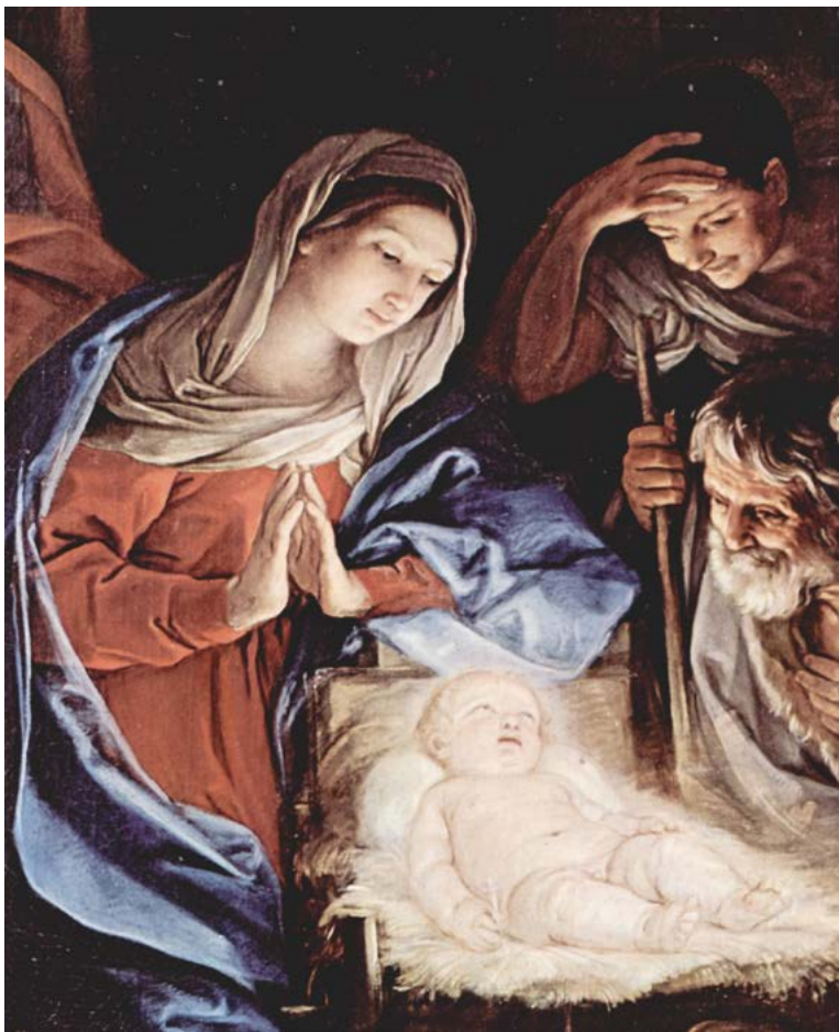
Paimenten ibailu (Guido Reni).

kvinnas kan få, hon är verkligen gudaföderska, Guds mor. Men se på hennes liv - inte finns det mycket ära sett med mänskliga ögon. En tvivlande trolovad, arga släktingar, en svår resa, stallet som förlossningssal och herdarna som gratulerar. Och ändå ligger en oerhörd välsignelse från Gud dold i allt detta: Frälsaren själv föds. När vi ser på oss själva ser vi hur Gud döljer våra liv i litenhet, lidande, smärta och motgångar. Gud för oss så närmare Jesu kors och döljer sina gåvor för världen och till och med för oss. Så när du lider - tro inte att Gud har övergivit eller glömt dig.