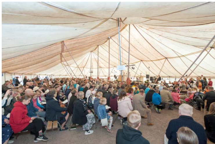
Juhlamessu kokosi n. 750 juhlavierasta sanan ja sakramentin äärelle.

Jos Jumala suo, ensi vuoden kesäjuhlat pidetään myös Loimaan evankelisella kansanopistolla 31.7.–2.8.2020. Kesäjuhlan äänitteet ovat kuunneltavissa osoitteessa: www.lhpk.fi/kesajuhlat/kuuntele/