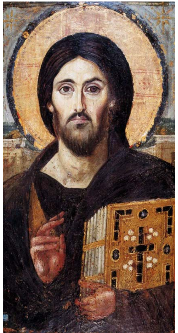
Kristus Vapahtaja, 500-luvun ikoni Pyhän Katariinan luostarissa, Siinain vuorella.

Tarvitset Raamattua, jotta opit tuntemaan Jumalasi.