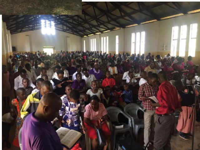
Itieriossa toinen päiväjumalanpalvelus menossa. Ensimmäisessä oli 200 seurakuntalaista, jälkimmäisessä 400. LHF on julkaissut kisiinkielisen vursikirjan. Nyt toinen laajennettu painos on työn alla.

kristillisiä kirjoja, etenkin luterilaisia – omalla kielellään vielä vähemmän. Tavoitteena onkin luoda papeille ja kristityille peruskirjasto, joka sisältää katekismuksen, virsikirjan, hartauskirjoja sekä teologista