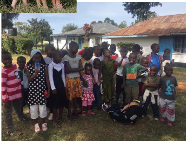
Itä-Afrikassa seurakunnat ovat täynnä lapsia. LHF julkaisee enenevissä määrin lasten Raamattuja ja pyhäkoulumateriaalia.