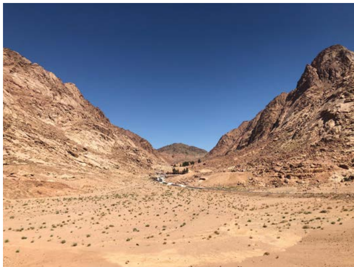
Näkymä Siinain vuoren juurelta.

Jumalan saapuessa ”alkoi jylistä ja salamoida (...) kuului ylen kova pasuunan ääni” (2. Moos. 19:16). Apostolien ollessa koolla ”tuli yhtäkkiä humaus tai vaasta, niin kuin olisi käynyt väkevä tuulispää” (Ap. t. 2:2). Siinailla ”koko vuori peittyi savuun, kun Herra astui sille tulesta” (2. Moos. 19:18) ”ja sinä kuulit hänen sanansa tulen keskeltä” (5. Moos. 4:36).