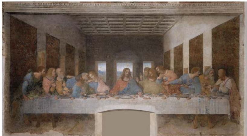
Leonardo da Vinci: Viimeinen ehtoollinen.

Paavali kirjoittaa: ”Jos korva sanoisi: ’Koska en ole silmä, en kuulu ruumiiseen’, niin ei se silti olisi ruumiiseen kuulumaton.” (1. Kor. 12:15) Jokaisella kristityllä on paikkansa ja Jumalan tarkoittama tehtävänsä osana seurakuntaa.