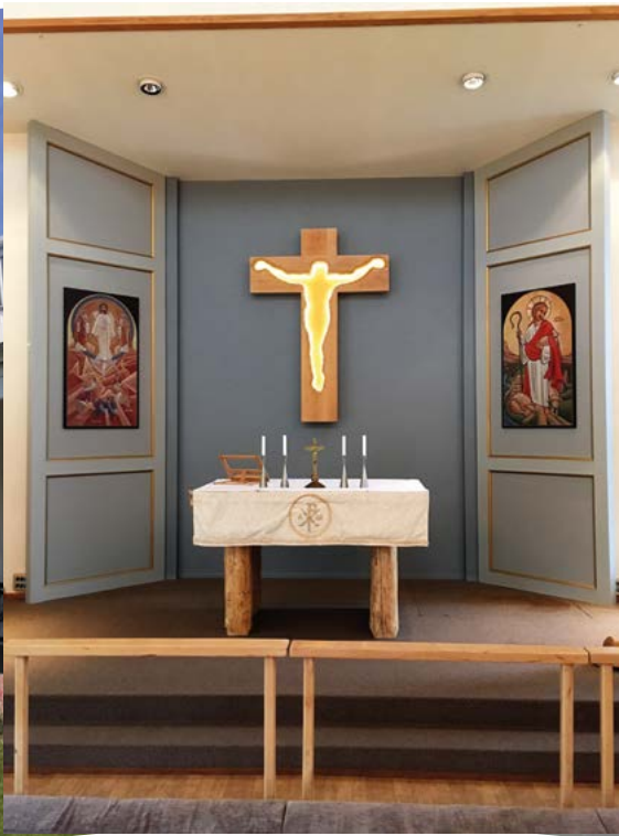
Portarna är öppnade, in i det allra heligaste.