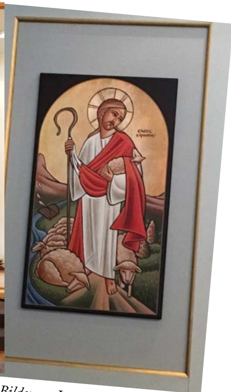
Bilden av Jesus som den gode herden "säger mer än 1000 ord" men först därför att Skriften talat om herden med ord.