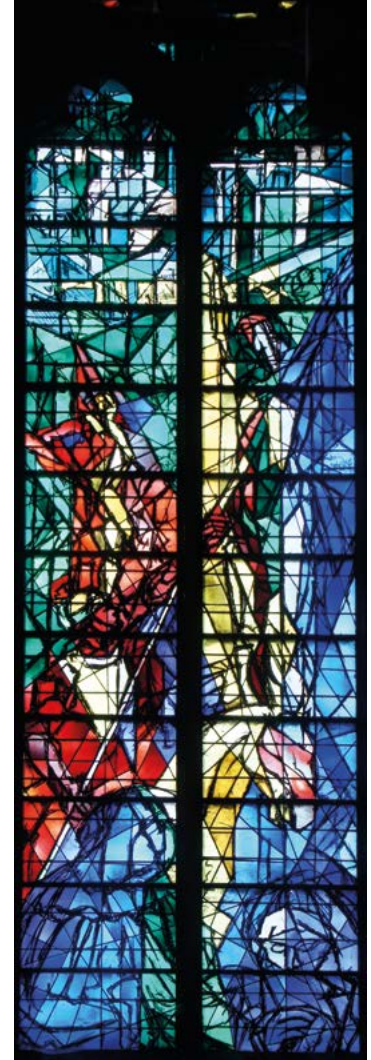
Metzin katedraalin lasimaalausikkuna Ristiinnaulitseminen: yksi sotilasta työnsi keihään hänen kylkeensä. Haavasta vuoti heti vettä ja verta. (Marc Chagall)

Kirkolla ja seurakunnilla ei ole taloudellisia resursseja niin kuin joskus. Suuret rahat ovat taidesäätöillä ja apurahaorganisaatioilla. Niiden rahoista kilpailu kristillisen uskon traditioista nousevilla taideteemoilla lienee mahdotonta. Mitä voimme siis tehdä? Voimme tyytyä ehkä vaatimattomampaan, mutta ei