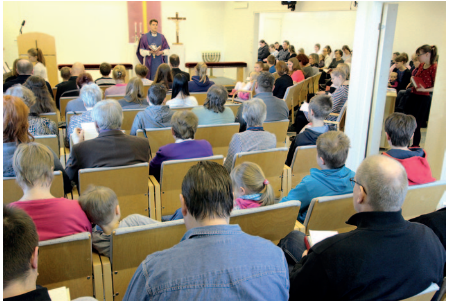
Jakautuminen kahteen messuun on ensiaskel kohti kahta kasvavaa seurakuntaa.

Siksi asiaan oli pikaisesti puututtava. Ensimmäisenä adventtina 2016 aloimme ensi kertaa pohtia jotain muuta vaihtoehtoa kuin isompia tiloja. Kun joitakin vuosia sitten Helsingin Pyhän Markuksen luterilainen seurakunta oli vastaavassa tilanteessa, osa seurakuntalaisista alkoi rakentaa uutta seurakuntaa Espooseen ja myöhemmin myös Vantaalle. Nyt pääkaupunkiseudulla on kolme kasvavaa seurakuntaa yhden ison ja täynnä olevan seurakunnan sijaan. Tästä rohkaistu-