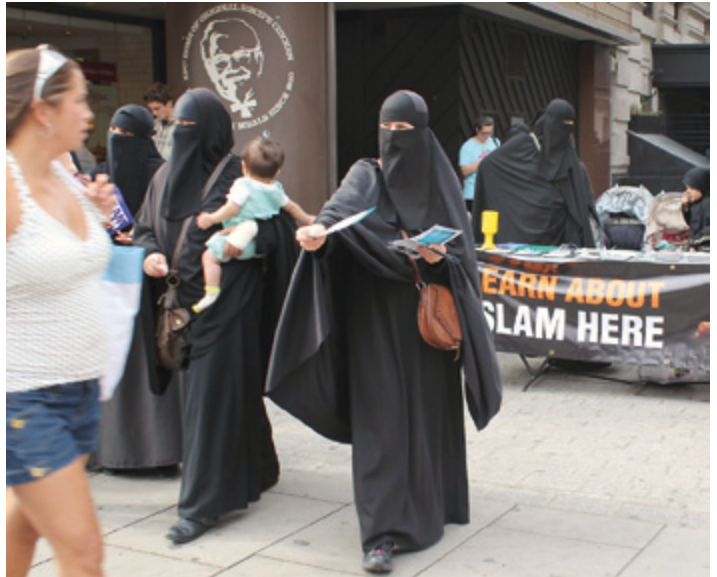
Musliminaiset tekemässä käännöstyötä Lontoon kaduilla vuoden 2012 olympialaisten aikana.

Pyhä sota, jihad ("Jumalan tien kulkeminen") on seuraavalla sijalla islamin viiden pilarin jälkeen, lähes kuudes sellainen. Suomalaisessa ja länsimaaisessa keskustelussa sitä on yritetty häivyttää näkyvistä, mutta hyökkäys New Yorkiin 11.9.2001 avasi kaapin ovet. Tällä hetkellä kukaan ei enää yritäkään kieltää jihadin keskeistä asemaa islamissa. Jihad on kuitenkin laajempi käsite kuin pelkästään sotaretkelle lähteminen. Se on toisten uskontojen tunnustajien elintilan, elämän ja kulttuurin vähittäistä haltuun ottamista ja islamilaisen elämäntavan pystyttä-