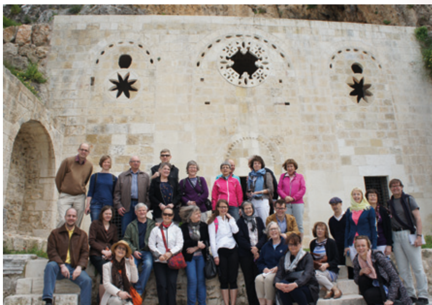
Matkalaiset Pyhän Pietarin luolakirkon edessä. Kirkon julkisivu on ristiretkeläisten rakentama kirkon laajennuksen myötä 1100 luvulla.

Antiokiasta on viikon kävelymatka Tarsoon. Tuon matkan Barnabas teki saatuaan tehtäväkseen hakea Paavali Antiokiaan. Kun Tarson kaupungissa on nytkin helposti löydettävissä Paavalin kaivo, lieneekö Paavali ollut Kilikiassa levittämässä evankeliumia, kun Barnabas sai etsiä Paavalia. Kaivon vieressä lasilevyjen alla on roomalaiskauden aikaisen talon perus-