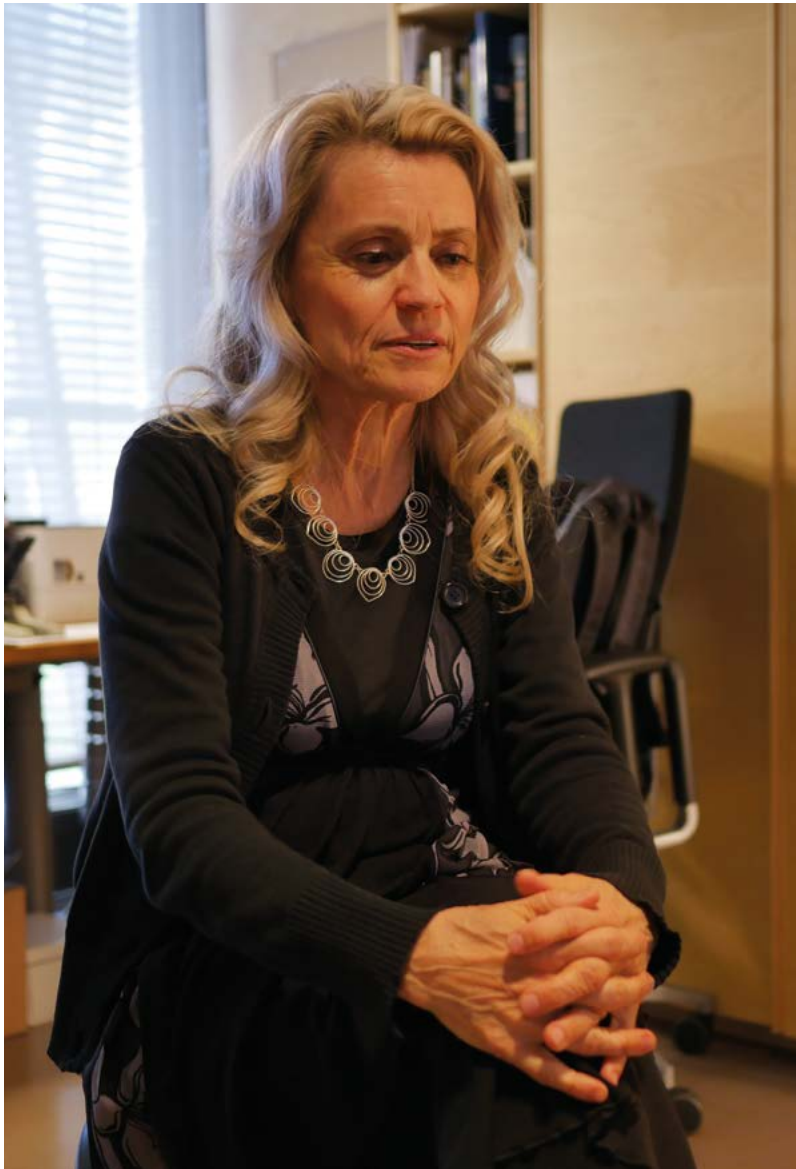
Päivi Räsänen jatkaa omantunnonvapauden puolesta puhumista aborttiasiassa.

- Muutaman vuoden sisällä on räjähdysmäisesti kasvanut niiden nuorten määrä, jotka haluaisivat vaihtaa sukupuolta, varsinkin tyttöjen. Kuitenkin asiantuntijat ovat huolestuneita siitä, että on hyvin paljon esimerkiksi eriasteisesta autismista kärsiviä nuoria, joilla on sukupuolidysforiaa, joka sinän-