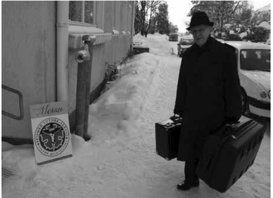
Matti-piispa kantoi laukkujaan piispanvierailulla kovasta pakkasesta ja kiireestä huolimatta hymyillen.

sön hallitukselle aiheesta Lähetyshiippakunta. Väki kuuntelee korva tarkkana kirkollisen rakenteen suuntaviivoja. Asiaa tarkastellaan monelta kantilta. Tätä on hieno olla rakentamassa!