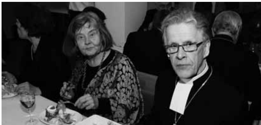
Illalla tuore piispa ja piispatar nauttivat maukkaasta illallisesta, hyvistä seurasta ja lennokkaista puheista Koinonia-keskuksessa.