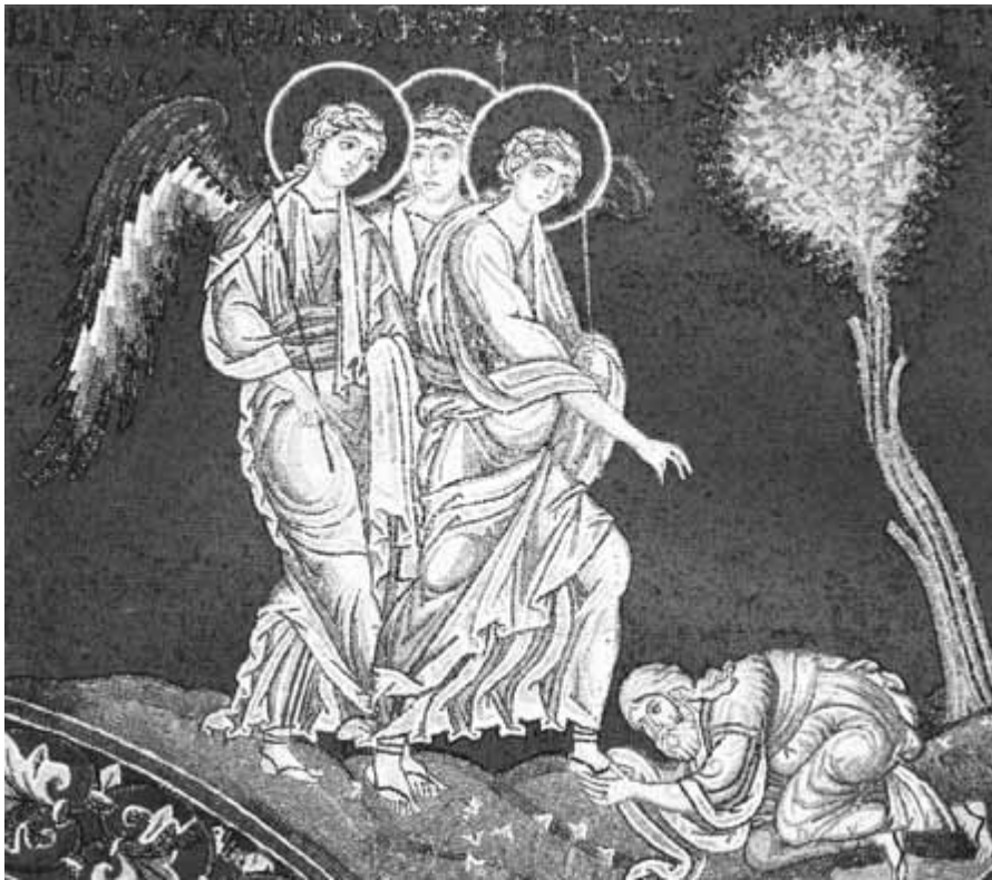
Aabraham kumartaa Pyhää Kolminaisuutta.

vaellamme, ja ilmaisee siinä meille oman olemuksensa yhdistävänä Rakkautena.