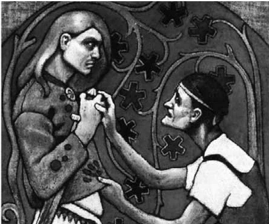
Velisurmaaja. Akseli Gallen-Kallela 1897.